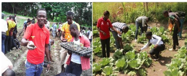
Travaux pratiques au carré potager