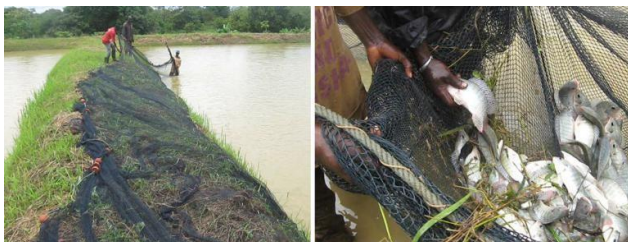
Séance de pêche de contrôle