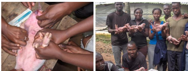
Séance de castration